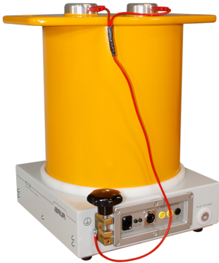
Ilustración a modo de ejemplo