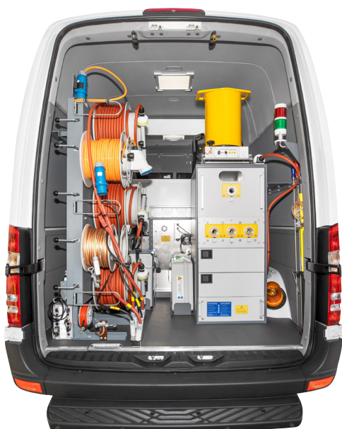
Ejemplo de colocación del PD-TaD en un vehículo de medición de cables

Requisito: Disponibilidad de las correspondientes funciones de software del software BAUR 4.