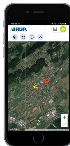
Beispiel: Kartenansicht in der BAUR Fault Location App (nur bei Steuerung über Laptop und BAUR Software 4 verfügbar)