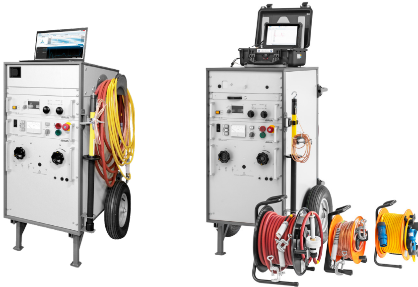
Afbeeldingen zijn illustratief