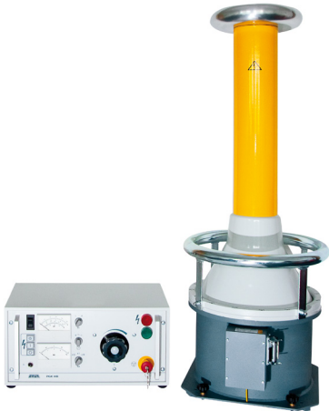
Ilustración a modo de ejemplo