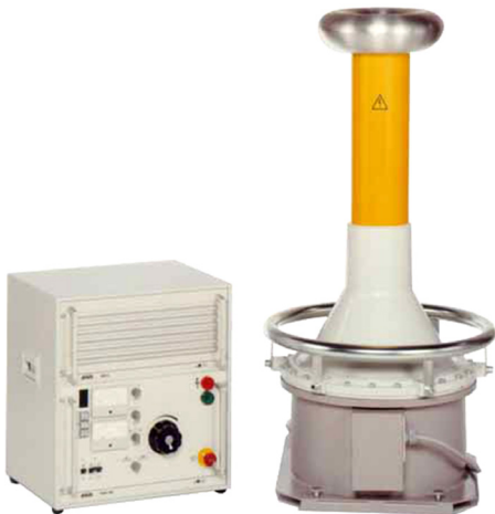
Figura a titolo esemplificativo