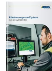
Kabelmesswagen und Systeme