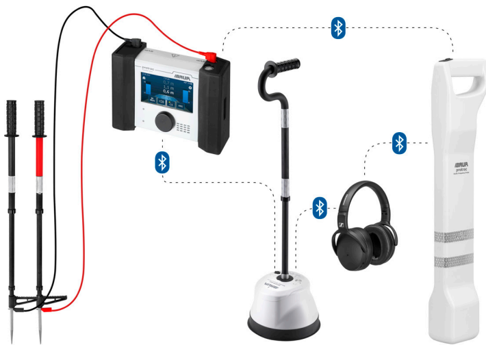
Prikaz kao primer