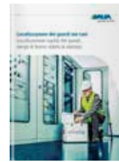
Localizzazione dei guasti nei cavi