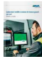
Laboratori mobili e sistemi di ricerca guasti sui cavi