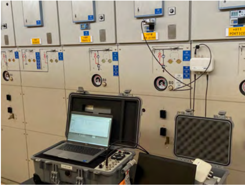
Imagen 5. Las secuencias de medición automatizadas y la evaluación asistida por software permiten medir las descargas parciales en línea en solo unos minutos.

rápido, sin desconectar el tendido de cable y, por tanto, sin costosas medidas de seguridad, el usuario del acoplamiento DP VDS cuenta con las siguientes ventajas: