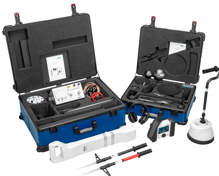
Figure a titolo esemplificativo