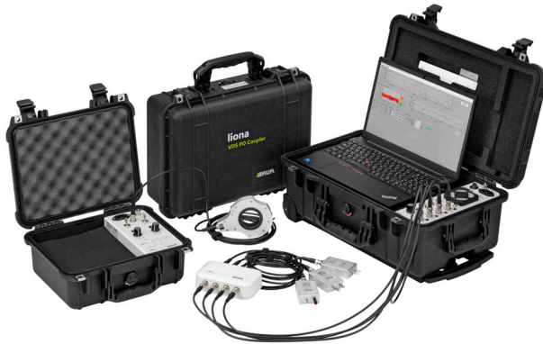
Ilustración: liona con acoplamiento DP VDS y transmisor-receptor opcional iPD