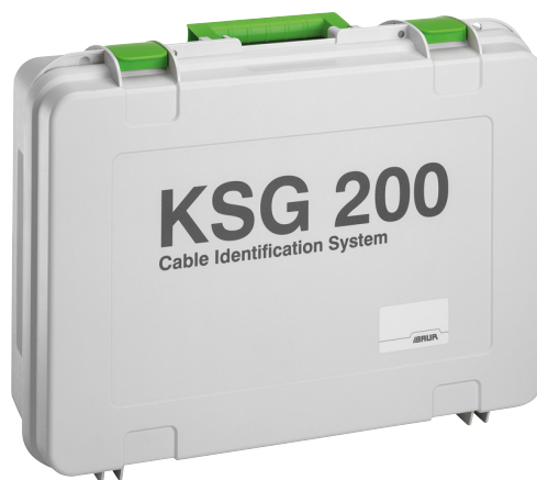
Slika: KSG 200 T (bez baterije)