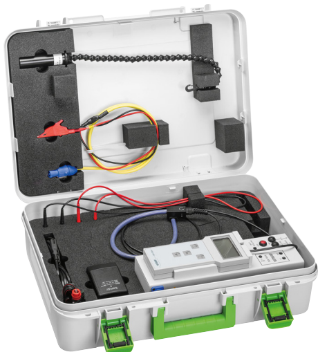
Slika: KSG 200 TA (sa baterijom)