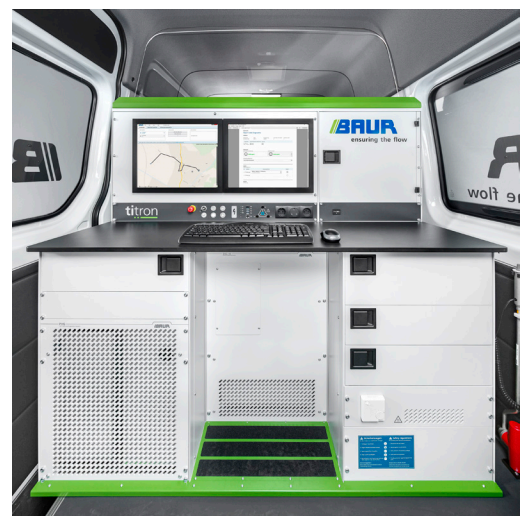
Figure a titolo esemplificativo