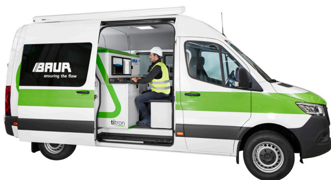
Figura a titolo esemplificativo